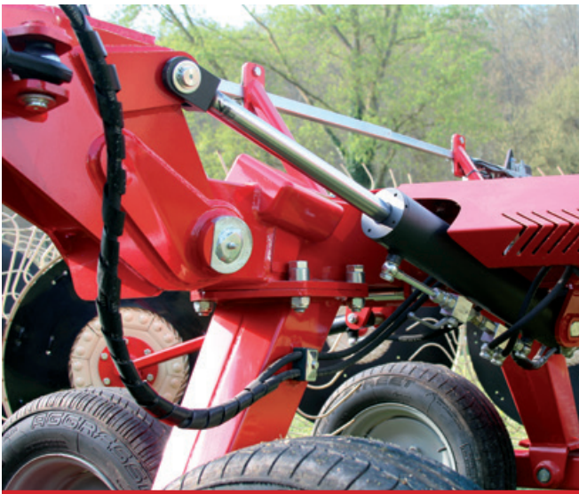
Dispositivo idraulico per lavorare con un solo lato di serie. / Hydraulic valves standard to operate one side. / Kit válvulas hidráulicas estándar para operar en un solo lado. / Vanne pour travail à rang individuel.