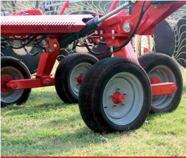
Assale tandem di serie su entrambi i modelli. / Tandem axles standard on both models. / Ejes tándem estándar en ambos modelos. / Essieux tandem de série sur les modèles.