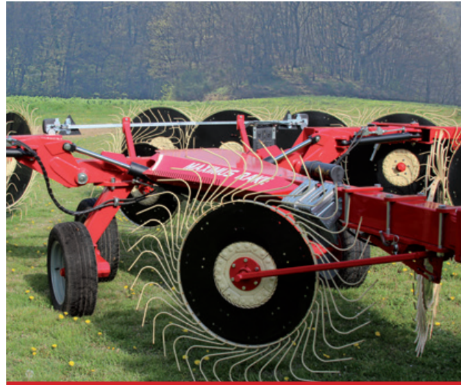
Kit stelle centrali. / Kicker wheel kit. / Soles centrales para mover el producto. / Soleil central avec 2 soleils avant et un soleil arrière.